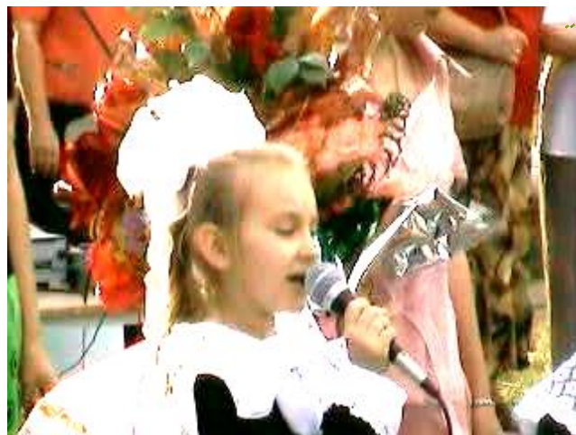
С самого первого дня в школе первоклассники начали активно участвовать в самодеятельности.