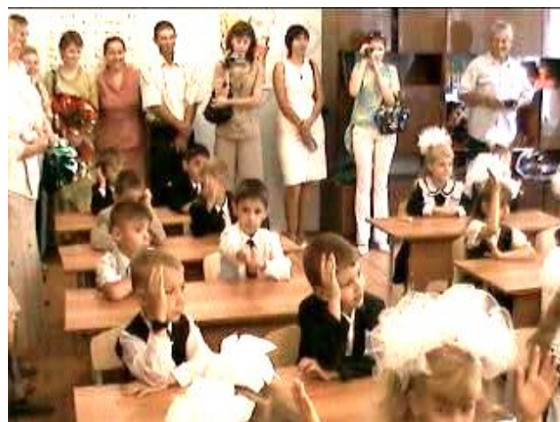
Самый важный урок—самый первый.