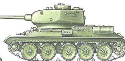
T-34-85 образца 1944 года