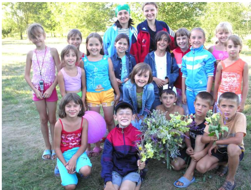
Лагерь «Орленок» 4-й отряд