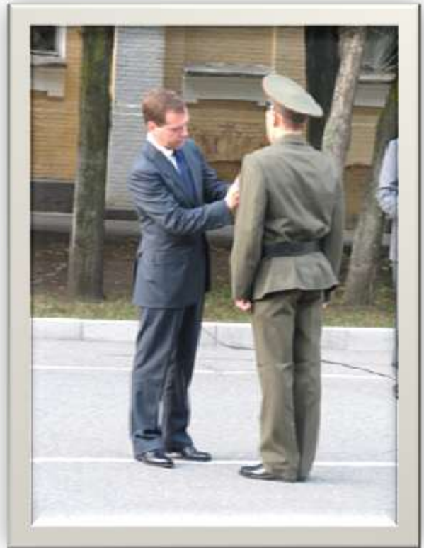
Президент России вручает награду Манмареву Ивану