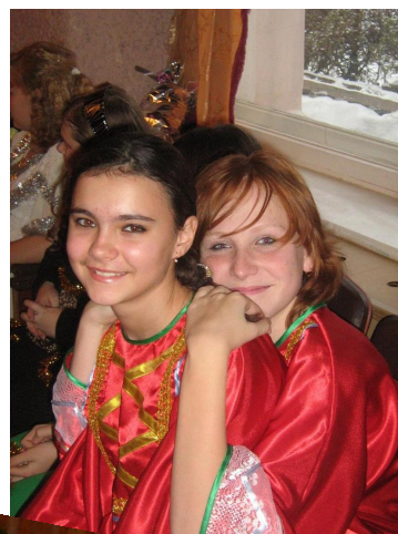
Самые улыбочки-вые девчонки на Профсоюзной елке