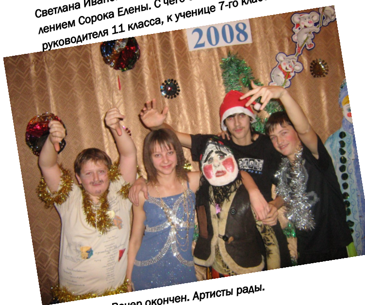
Вечер окончен. Артисты рады.