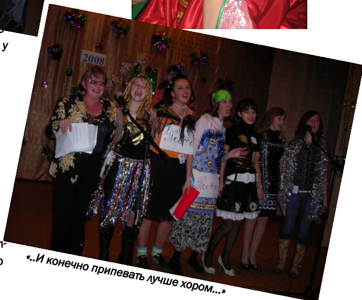
«...И конечно припевать лучше хором...»