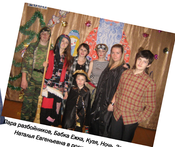
Пара разбойников, Бабка Ежка, Кузя, Ночь, Зорро и Наталья Евгеньевна в роли завуча школы.