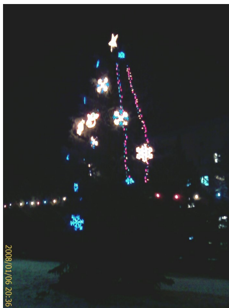
Самая красивая Орловская Новогодняя елка (на территории больницы)