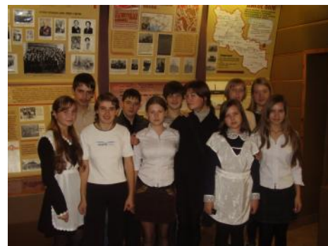
Активисты школьного музея 2007 год