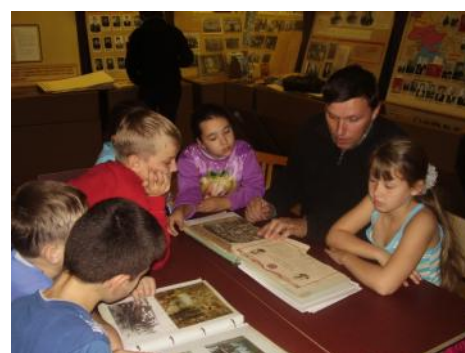
Экскурсия 2007 год