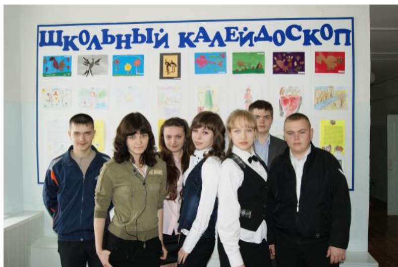
Инициативная группа проекта «ЗЕЛЕНый ДВОР»

Подробности читайте в ближайшем специальном выпуске газеты «ЭКО».