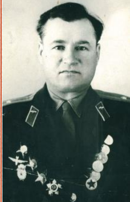
Майор Лыमारь Григорий Семенович

В ночь со 2 на 3 июня 1944, года выполняя задание разведать движение эшелонов на участке Горки-Орша на станции Зубры обнаружил три воинских эшелона. Сбросив световую авиабомбу дал возможность другим эшелонам вести бомбардировку. Опустившись на 400 метров прицельно бомбил и повредил эшелон. (из наградного листа)