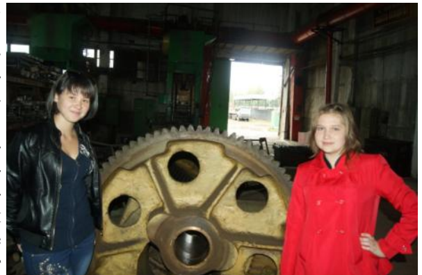
Остановка у небольшой шестеренки

Сейчас «Корммаш» предлагает сельхозтоваропроизводителям широкий спектр техники для обработки почвы, внесения удобрений, сбора и хранения урожая. На предприятии есть свой конструкторский отдел, который, ориентируясь на нужды клиентов, постоянно дорабатывает и модернизирует технику, а также разрабатывает новые образцы. Одни из последних разработок орловских сельхозмашиностроителей — погрузчик зерна ПЗН-250, культиватор КСП-4, разбрасыватель