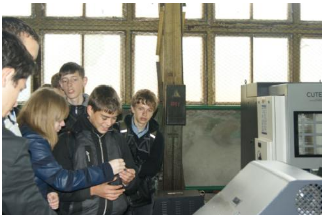
Изучаем процесс обработки металлов

Завод оснащен современным оборудованием, отвечающим современным требованиям: прессо-