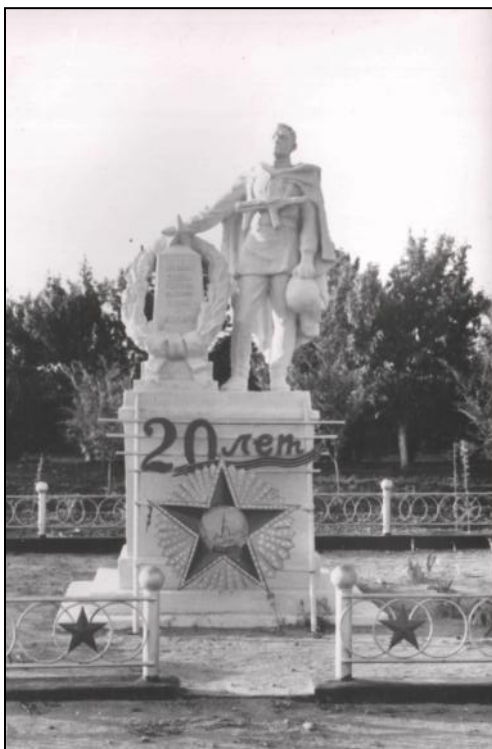
Первый памятник на братской могиле в центральной части поселка

Бои за Орловский район продолжались 12 дней. Тысячи наших воинов навечно остались в Орловской земле. Большая часть из них похоронена безымянными, но память о них жива в наших сердцах. На территории района 40 братских захоронений в которых похоронено 5800 бойцов и командиров Красной армии.