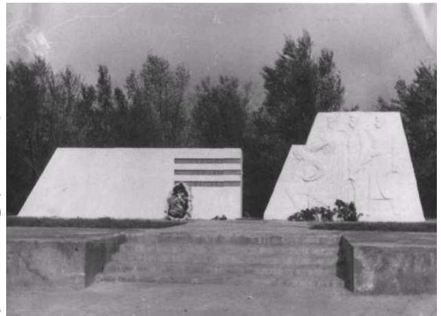
Памятник на площади Юбилейной. Просуществовал с 1968 по 1983 год

В 1968 году могила была перенесена и на новом месте была установлена стела представленная на фотографии, к 40-летию Победы был построен новый мемориал представленный на цветном фото. Ещё одно массовое захоронение расположено по улице Северной. В нем похоронено 243 военнослужащих зверски замученных фашистами 8 января 1943 года, а также воины погибшие на восточной окраине по-