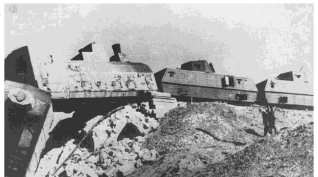
Бронепоезд №2 (погиб у разъезда Сал)

Каждый дивизион задержал наступление фашистов на 3-4 дня, чтобы их задержать фашисты вынуждены были взрывать мосты, разрушать дороги, а значит и сами не могли