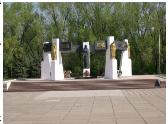
Воинский мемориал на площади Юбилейная.

Еще одна могила расположена на кладбище. Там похоронены 88 бойцов, умерших от ран в Орловском госпитале в январе—марте 1943 года.