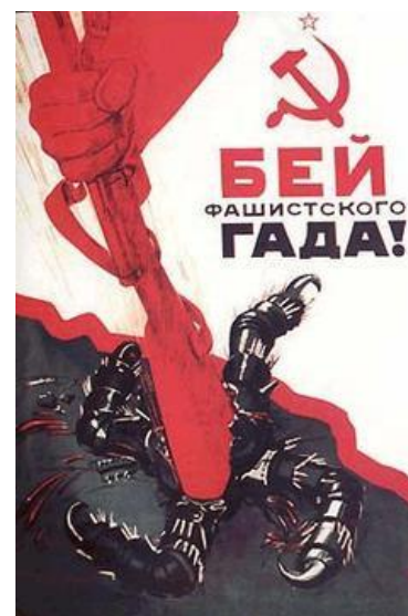
Плакат 1943 года

тивника дивизии СС «Викинг». Оставшиеся в живых бежали в панике, не успев взорвать заминированный продовольственный склад. В поселке и на станции захвачено много различного военного имущества. В числе трофеев - 26 паровозов, 120 вагонов и платформ, бронепоезд, 3 танка, 40 автомашин, 4 тысячи тонн зерна и 5 продовольственных складов. В боях за станицу Орловскую кроме того, уничтожено 9 танков, 6 орудий, 9 минометов, 14 станковых пулеметов