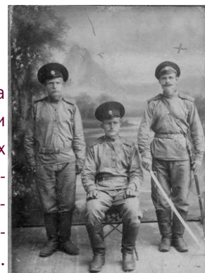
Казаки станицы Орловской 1915 г.

К началу XX века земли на Орловской, названа я в честь В.П.Орлова.