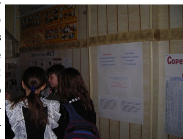
Выборы Совета старшеклассников.