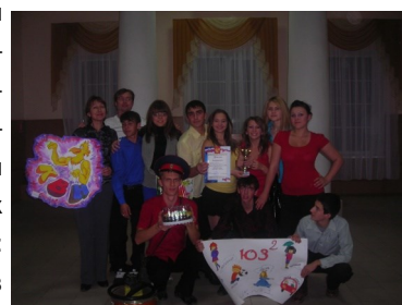
Финал Орловской лиги КВН.