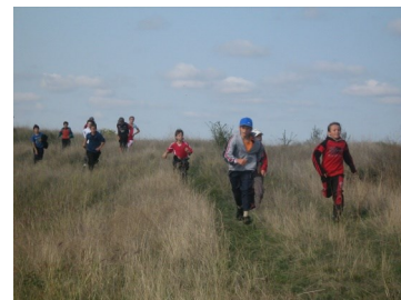
Казачий поход станицы «Первошкольной».