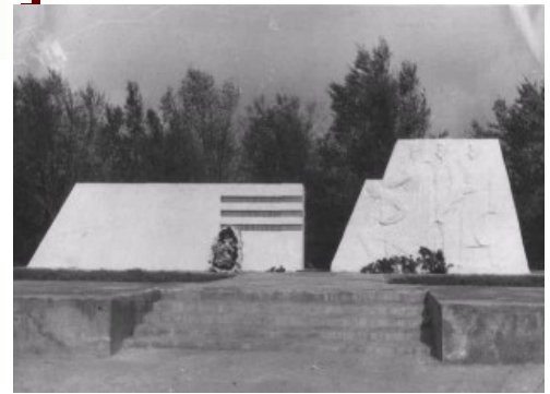
Рис №1 Мемориал на площади «Юбилейная» 1973-1983 годы

К 100-летию Ленина гипсовую фигуру заменили на бронзовую, которую перенесли на современное место в 1973 году.