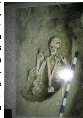
Женское захоронение. Курган Орловский 1.