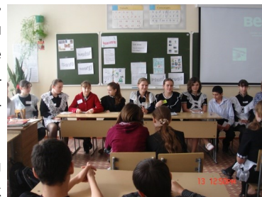
Неделя иностранного языка.